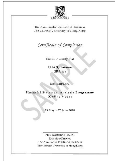
香港中文大学结业证书